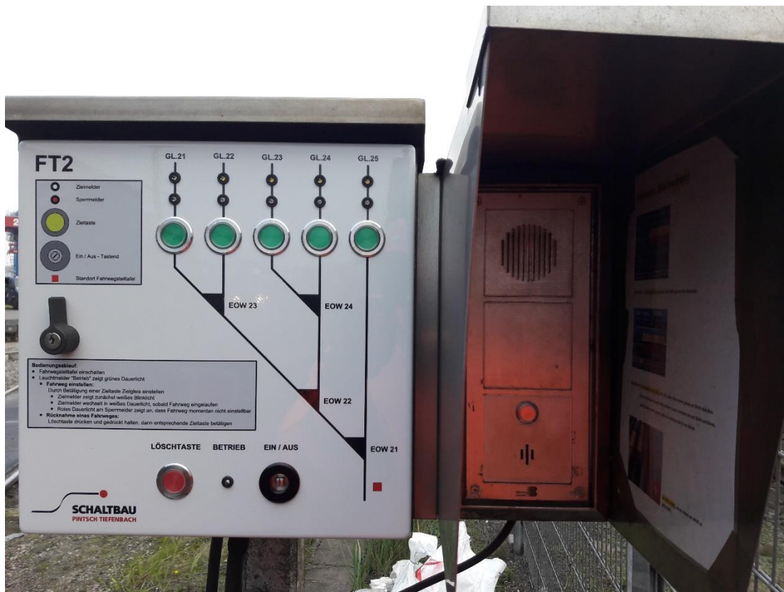
Fahrwegstelltafel 2 mit Sprechanlage (für Nordmodul)